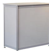
1 Octanorm-Counter weiß, mit Einlegeboden und abschließbaren Schiebetüren 103 x 103 x 54 cm