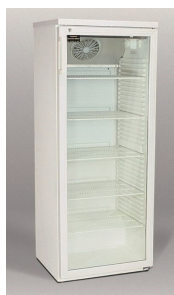
1 Flaschenkühlschrank, 352 Liter mit Glastür 157 x 60 x 60 cm